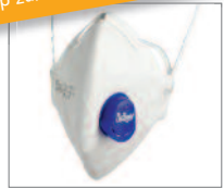
X-plore 1730 FFP3 ohne CoolMAX™ Ausatemventil