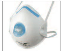
X-plore 1320 FFP2 ohne CoolMAX™ Ausatemventil